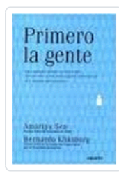
PRIMERO LA GENTE SEN,A /KLIKSBERG,B