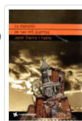
MANSION DE LAS MIL PUERTAS, LA (CUATROVIENTOS) SIERRA I FABRA, JORDI