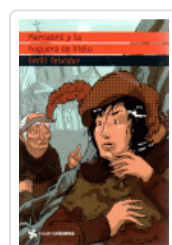
MARCABRU Y LA HOGUERA DE HIELO (CUATROVIENTOS) TEIXIDOR, EMILI