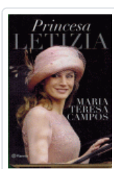
PRINCESA LETIZIA CAMPOS, MARIA TERESA