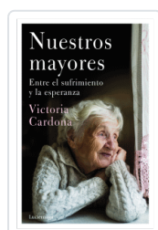
NUESTROS MAYORES CARDONA, VICTORIA