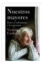
NUESTROS MAYORES CARDONA, VICTORIA