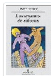
AMANTES DE SILICONA, LOS TOMEO, J