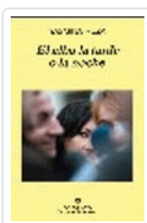
ALBA LA TARDE O LA NOCHE, EL REZA, Y