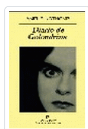
DIARIO DE GOLONDRINA NOTHOMB, A