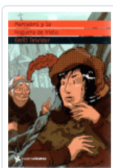
MARCABRU Y LA HOGUERA DE HIELO (CUATROVIENTOS)