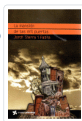
MANSION DE LAS MIL PUERTAS, LA (CUATROVIENTOS) SIERRA I FABRA, JORDI