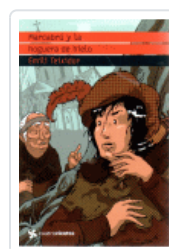
MARCABRU Y LA HOGUERA DE HIELO (CUATROVIENTOS) TEIXIDOR, EMILI