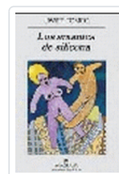
AMANTES DE SILICONA, LOS TOMEO, J