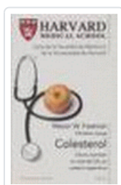
COLESTEROL (HARVARD MEDICAL SCHOOL) FREEMAN,M