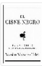
CISNE NEGRO,EL TALEB,N