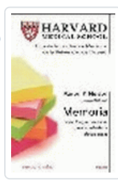
MEMORIA (HARVARD MEDICAL SCHOOL) NELSON,A