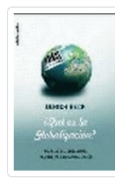
QUE ES LA GLOBALIZACION?