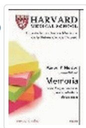
MEMORIA (HARVARD MEDICAL SCHOOL) NELSON, A