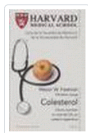
COLESTEROL (HARVARD MEDICAL SCHOOL) FREEMAN, M