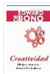
CREATIVIDAD DE BONO, E.