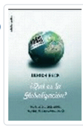
QUE ES LA GLOBALIZACION?