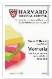
MEMORIA (HARVARD MEDICAL SCHOOL) NELSON, A