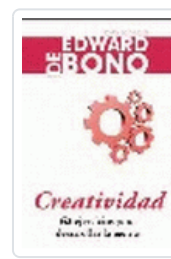
CREATIVIDAD DE BONO, E.