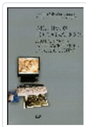
ARCHIVOS FOTOGRAFICOS: PAUTAS PARA UNA INTEGRACION DIGITAL SALVADOR BENITEZ, ANTONIA