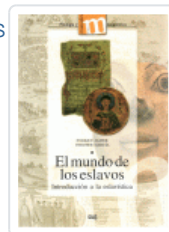
MUNDO DE LOS ESLAVOS, EL JAVIER, ENRIQUE/GARCIA, VERCHER