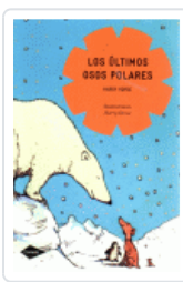
ULTIMOS OSOS POLARES, LOS (COMETA) HORSE, HARRY