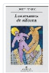
AMANTES DE SILICONA, LOS TOMEO, J