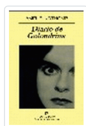
DIARIO DE GOLONDRINA NOTHOMB, A