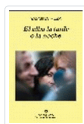
ALBA LA TARDE O LA NOCHE, EL REZA, Y