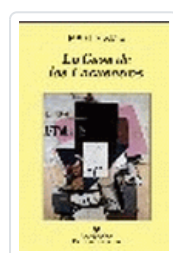
CASA DE LOS ENCUENTROS, LA AMIS, M