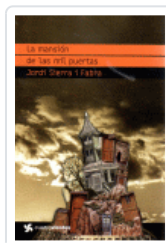
MANSION DE LAS MIL PUERTAS, LA (CUATROVIENTOS) SIERRA I FABRA, JORDI