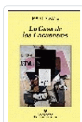
CASA DE LOS ENCUENTROS, LA AMIS, M