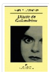
DIARIO DE GOLONDRINA NOTHOMB, A