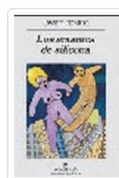
AMANTES DE SILICONA, LOS TOMEO, J