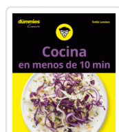
COCINA EN MENOS DE 10 MINUTOS PARA DUMMIES LARAISON, EMILIE