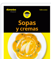
SOPAS Y CREMAS PARA DUMMIES LARAISON, EMILIE