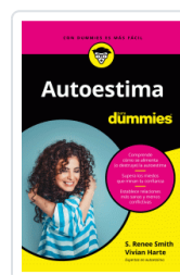
AUTOESTIMA PARA DUMMIES SMITH, S. RENEE / HARTE, VIVIAN