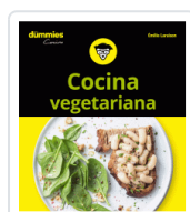
COCINA VEGETARIANA PARA DUMMIES LARAISON, EMILIE