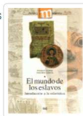
MUNDO DE LOS ESLAVOS, EL JAVIER, ENRIQUE/GARCIA, VERCHER