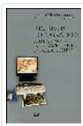
ARCHIVOS FOTOGRAFICOS: PAUTAS PARA UNA NTEGRACION DIGITAL SALVADOR BENITEZ, ANTONIA