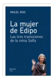
MUJER DE EDIPO, LA ROIG, MIGUEL