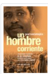
HOMBRE CORRIENTE RUSESABAGINA, PAUL