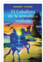
CABALLERO DE LA ARMADURA OXIDADA FISHER, ROBERT