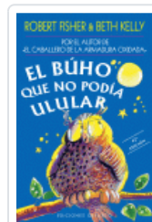
BUHO QUE NO PODIA ULULAR