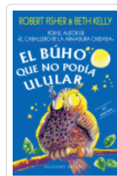
BUHO QUE NO PODIA ULULAR