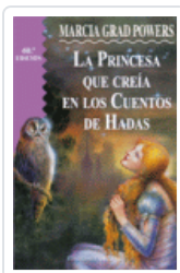
PRINCESA QUE CREIA EN CUENTOS DE HADAS