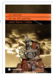
MANSION DE LAS MIL PUERTAS, LA (CUATROVIENTOS) SIERRA I FABRA, JORDI