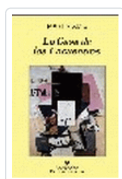
CASA DE LOS ENCUENTROS, LA AMIS,M