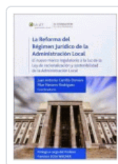
REFORMA DEL REGIMEN JURIDICO DE LA ADMINISTRACION VARIOS AUTORES