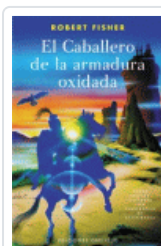
CABALLERO DE LA ARMADURA OXIDADA FISHER, ROBERT