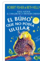
BUHO QUE NO PODIA ULULAR