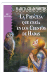
PRINCESA QUE CREIA EN CUENTOS DE HADAS