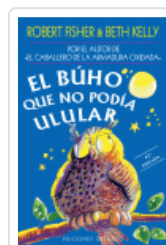
BUHO QUE NO PODIA ULULAR