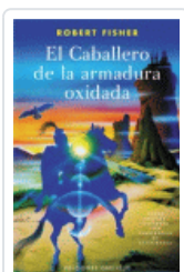
CABALLERO DE LA ARMADURA OXIDADA FISHER, ROBERT