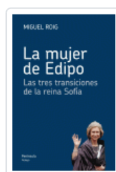
MUJER DE EDIPO, LA ROIG, MIGUEL