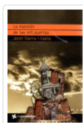
MANSION DE LAS MIL PUERTAS, LA (CUATROVIENTOS) SIERRA I FABRA, JORDI