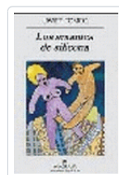
AMANTES DE SILICONA, LOS TOMEO, J