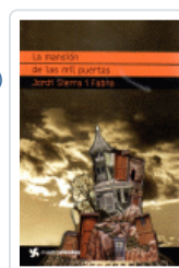
MANSION DE LAS MIL PUERTAS, LA (CUATROVIENTOS) SIERRA I FABRA, JORDI