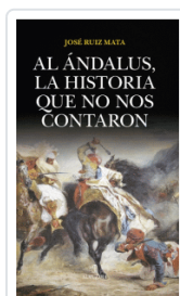
AL ANDALUS, LA HISTORIA QUE NO NOS CONTARON RUIZ MATA, JOSE