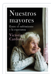
NUESTROS MAYORES CARDONA, VICTORIA