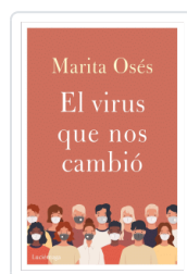
VIRUS QUE NOS CAMBIO, EL OSES, MARITA