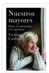
NUESTROS MAYORES CARDONA, VICTORIA