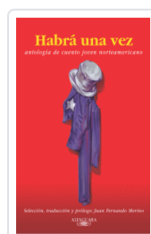
HABIA UNA VEZ VARIOS