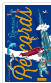
LAROUSSE DE LOS RECORDS VV.AA.