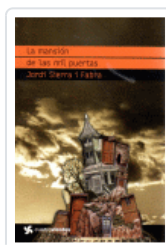
MANSION DE LAS MIL PUERTAS, LA (CUATROVIENTOS) SIERRA I FABRA, JORDI