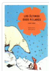
ULTIMOS OSOS POLARES, LOS (COMETA) HORSE, HARRY