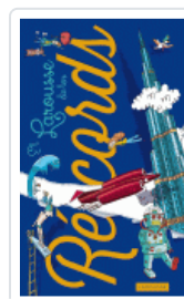
LAROUSSE DE LOS RECORDS VV.AA.