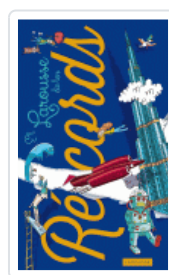
LAROUSSE DE LOS RECORDS VV.AA.