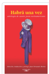
HABIA UNA VEZ VARIOS