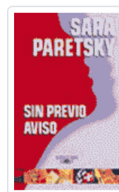
SIN PREVIO AVISO PARETSKY, SARA