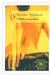
DIABLO GUARDIAN VELASCO, X.