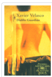
DIABLO GUARDIAN VELASCO, X.