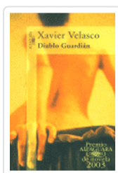
DIABLO GUARDIAN VELASCO, X.