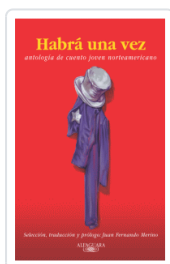
HABIA UNA VEZ VARIOS