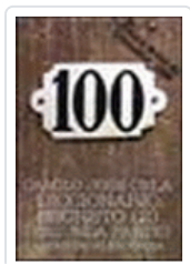
DICCIONARIO SECRETO VOL.2 (CELA) CELA, CAMILO J.