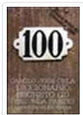
DICCIONARIO SECRETO VOL.2 (CELA) CELA, CAMILO J.