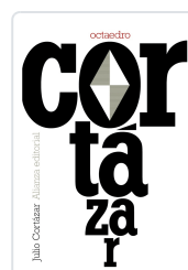
OCTAEDRO Cortázar, Julio