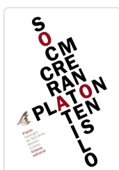
APOLOGÍA DE SÓCRATES / MENÓN / CRÁTILLO Platón