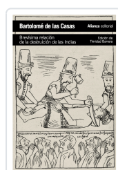
BREVÍSIMA RELACIÓN DE LA DESTRUCCIÓN DE LAS INDIAS Las Casas, Bartolomé de