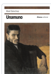
ABEL SÁNCHEZ Unamuno, Miguel de