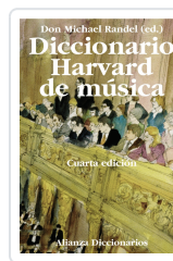
DICCIONARIO HARVARD DE MÚSICA Randel, Don Michael