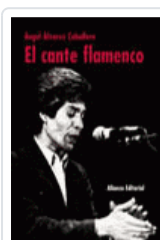
CANTE FLAMENCO, EL Álvarez Caballero, Ángel