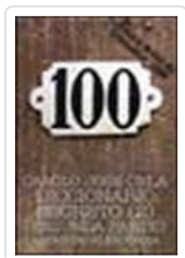
DICCIONARIO SECRETO VOL.2 (CELA) CELA, CAMILO J.